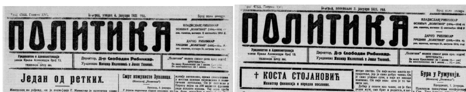
Насловне стране Политике 4 и 5 јануара 1921.г.